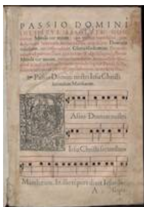
Officium Hebdomadae Sanctae et Paschatis. Salamanca: Matías Gast, 1582, fol. 2r