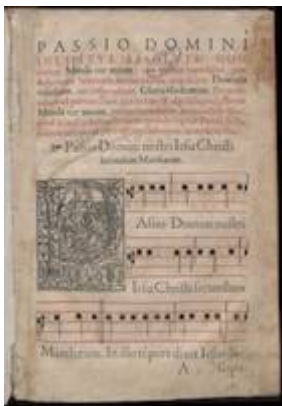
Officium Hebdomadae Sanctae et Paschatis. Salamanca: Matías Gast, 1582, fol. 2r