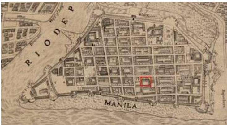
Convento de San Nicolás de Tolentino (1734)