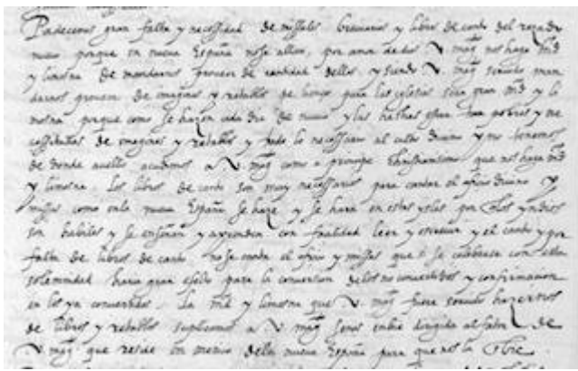
Carta de fray Andrés de Aguirre a Felipe II (1581)