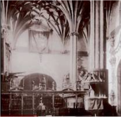
Antiguo coro de la catedral de Barbastro (2)