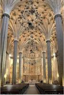
Interior de la catedral de Barbastro