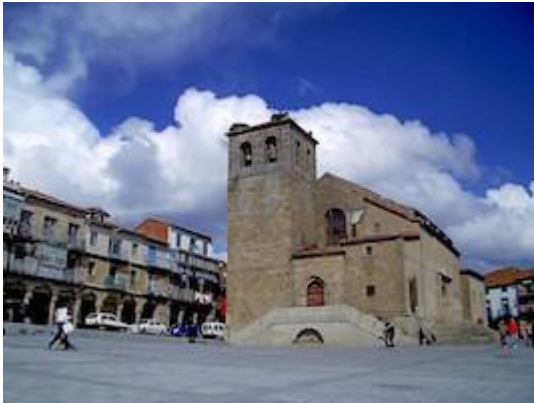
Iglesia del Salvador