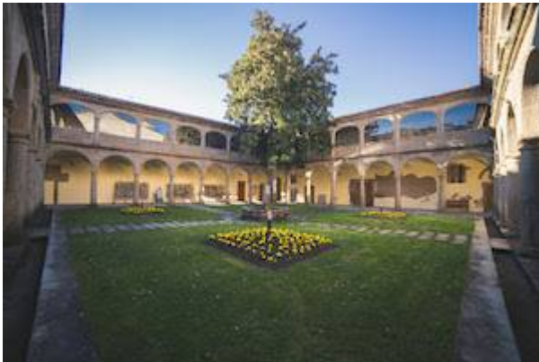
Convento de San Francisco