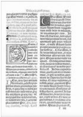
Missale... Hispalensis (Sevilla: Juan Gutiérrez, 1565), fol. cxi

https://embed.spotify.com/?uri=https://open.spotify.com/track/2ZgXkNyNPfV6HUVvGXoDD5?si=0b4bd0b38a03475a