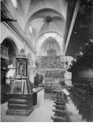
Coro de la catedral de Teruel