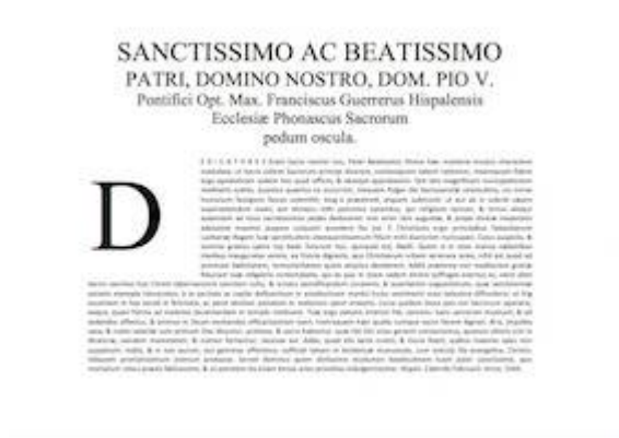
Transcripción de la Dedicatoria al papa Pío V