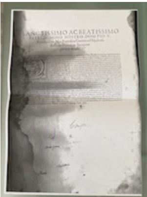
Dedicatoria al papa Pío V. Liber primus missarum (París, 1565). [E-TE 01-002]