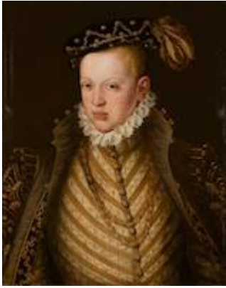
Retrato de Sebastián, rey de Portugal. Atribuido a Cristóvão de Morais (c. 1565)