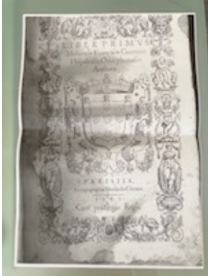
Portada. Liber primus missarum (París, 1565). [E-TE 01-002]