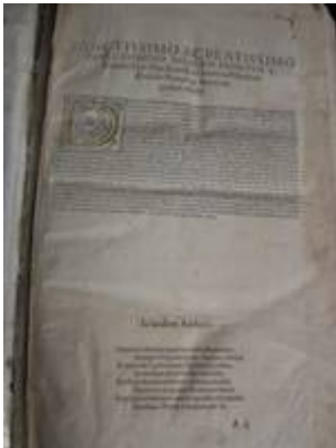
Dedicatoria al papa Pío V. Liber primus missarum (París, 1565). [E-BAZ]