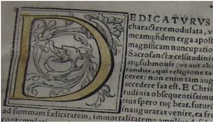
Dedicatoria al papa Pio V (detalle). Liber primus missarum (París, 1565). [E-BAZ]