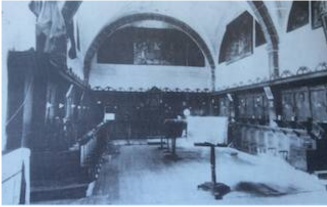
Coro del antiguo monasterio de Santa Ana en Ávila