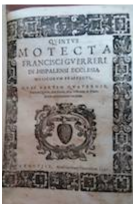
Motecta (1597). Francisco Guerrero. E:Asa 1