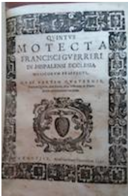
Motecta (1597). Francisco Guerrero. E:Asa 1