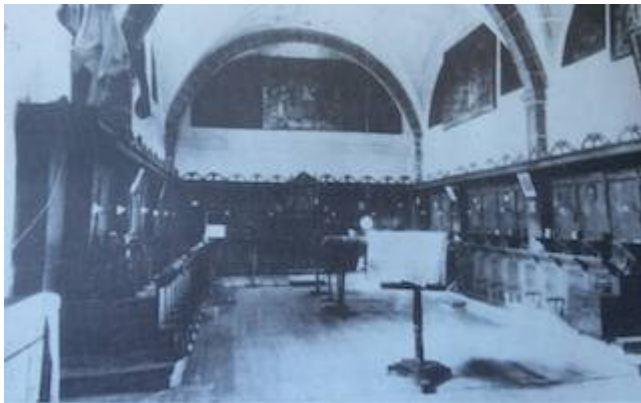
Coro del antiguo monasterio de Santa Ana en Ávila