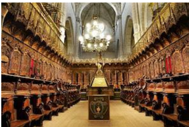
Coro de la catedral de Santa María en Ciudad Rodrigo (Salamanca)