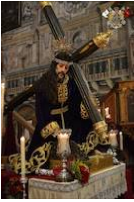
Jesús de las Tres Caídas (c.1683)