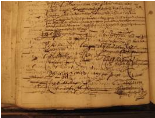
Rúbrica de los ministriles (1583)