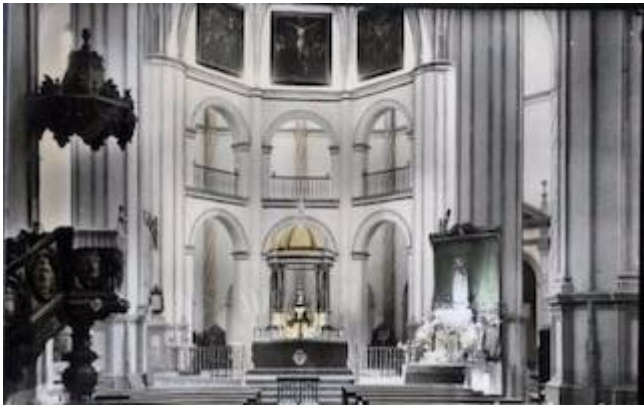
Colegiata de la Encarnación de Baza (Granada)