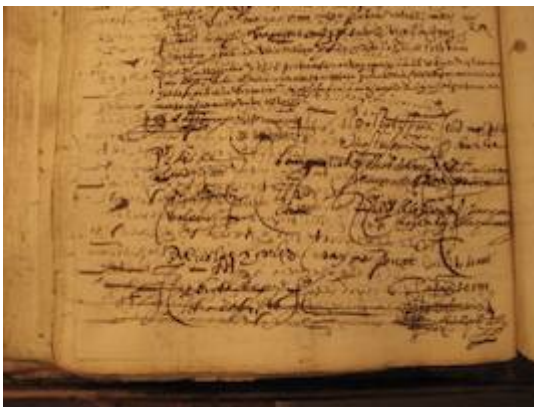
Rúbrica de los ministriles (1583)