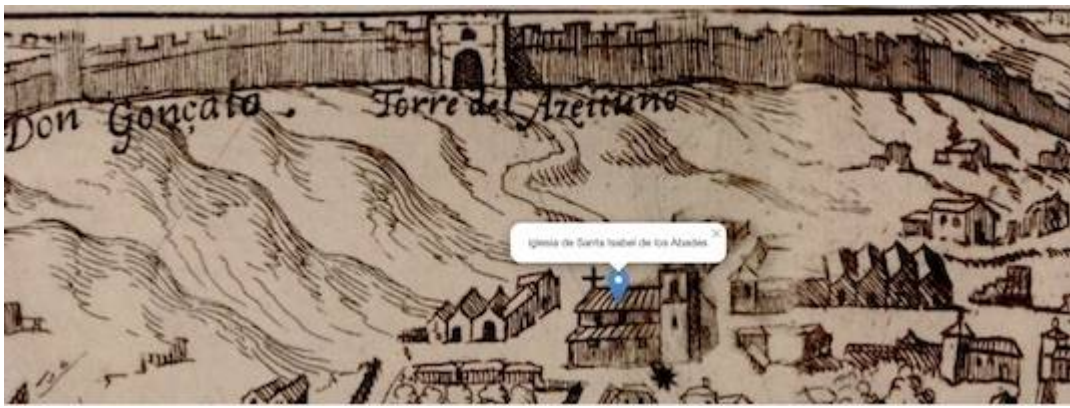
iglesia de Santa Isabel de los Abades. Plataforma de Ambrosio de Vito