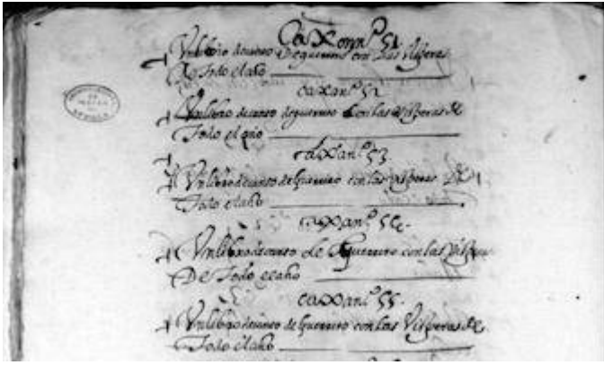
Archivo General de Indias. Contratación, 1.137, n. 13, fol. 88v