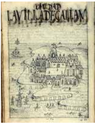
Ciudad la villa de Callau puerto de los Reyes de Lima. Felipe Guamán Poma de Ayala (1615)