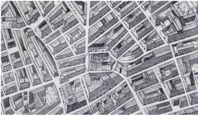
Convento de Nuestra Señora al Pie de la Cruz. Plano de Valencia. Tomás Vicente Tosca (1704)