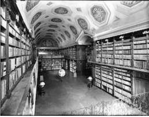
Antigua Biblioteca nazionale centrale Vittorio Emanuele II