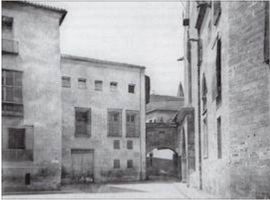
Palacio arzobispal Valencia. Foto antigua antes de su destrucción y reconstrucción.

"https://embed.spotify.com/?uri=https://open.spotify.com/track/5ZRE3ue6h89rWnVvBWrLIN?si=GDPMKQNNsIWwkQOiseHhyg