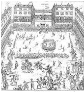
Juegos de toros y cañas en la Plaza Mayor de Valladolid (1592). Le passetemps . Jehan L'Hermitte