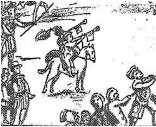
Trompetas (detalle). Juegos de toros y cañas en la Plaza Mayor de Valladolid (1592). Le passetemps . Jehan L'Hermitte