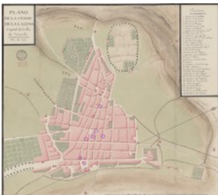
Plano de la ciudad de La Laguna (1779)