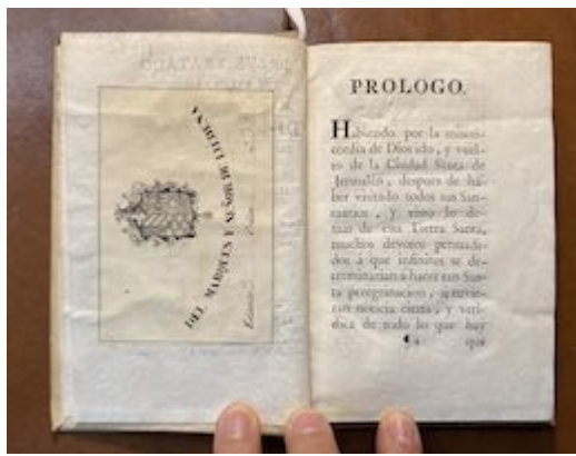
Breve tratado del viage que hizo a la ciudad Santa de Jerusalem. Francisco Guerrero. Real Academia de Bellas Artes de San Fernando (Madrid). Biblioteca, A-1792 (exlibris)