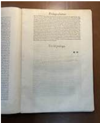
Orphenica lyra. Miguel de Fuenllana [E-Mba PA-2] (inscripción)