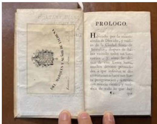
Breve tratado del viage que hizo a la ciudad Santa de Jerusalem. Francisco Guerrero. Real Academia de Bellas Artes de San Fernando (Madrid). Biblioteca, A-1792 (exlibris)