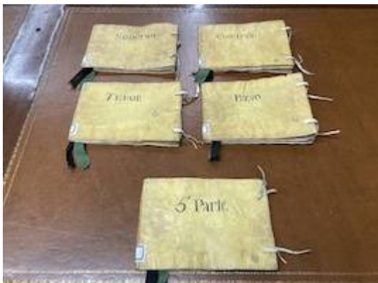
Sacrae cantiones . Francisco Guerrero. Cubiertas libretes. Real Academia de Bellas Artes de San Fernando (Madrid). Biblioteca, A-2411-A-2415