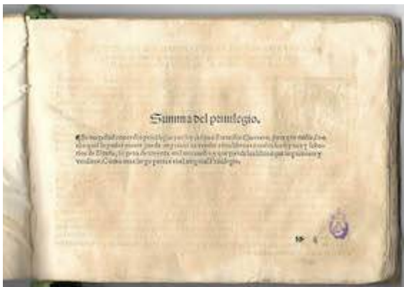
Sacrae cantiones . Francisco Guerrero. Privilegio impresión librete de tenor. Real Academia de Bellas Artes de San Fernando (Madrid). Biblioteca, A-2411-A-2415