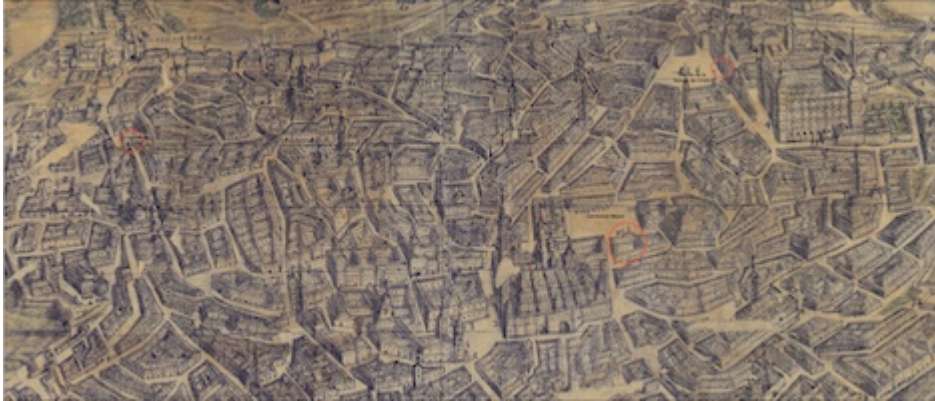
Vista de Toledo. José Arroyo Palomeque (1720)