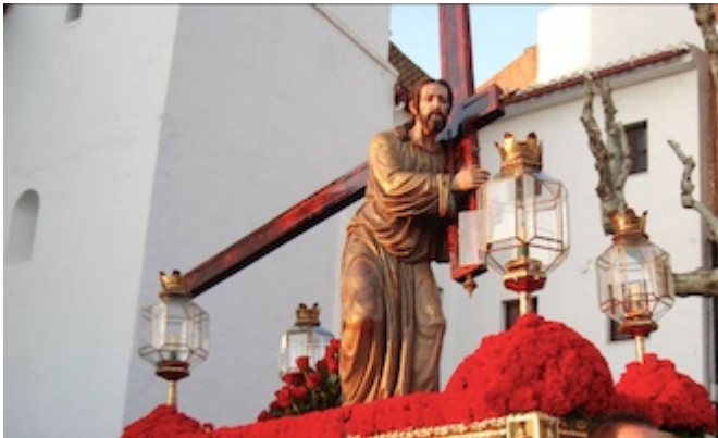
Nuestro Padre Jesús Nazareno. Pablo de Rojas (atribuida). Actualmente en la iglesia de Nuestra Señora de la Encarnación de Huétor Vega (Granada)