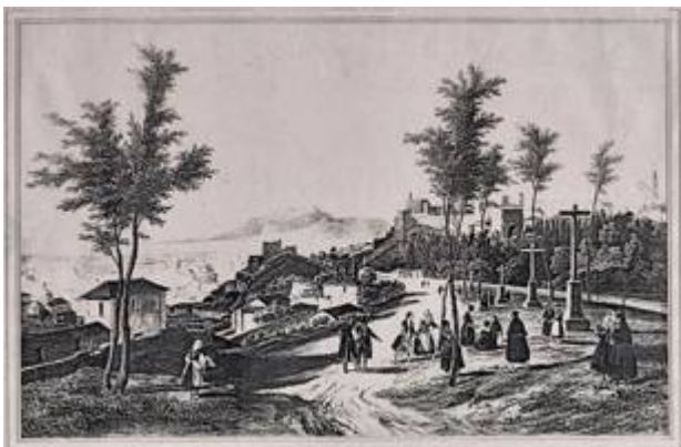
Paseo de las cruces. Convento de los Mártires. Nicolas Chapuy (1844)