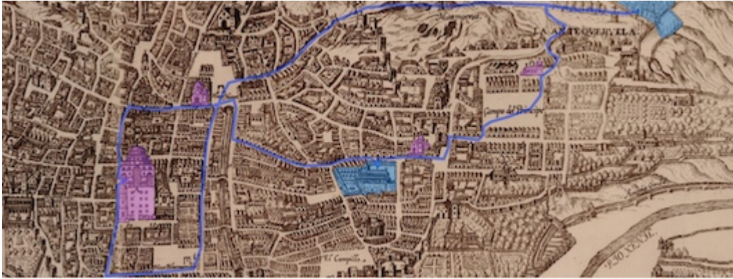
Itinerario de la cofradía de Jesús Nazareno y Santa Elena (hipótesis 2)