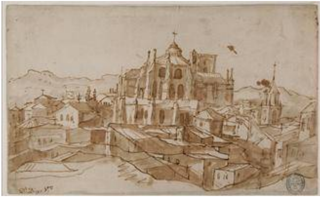
Vista de la catedral con el campanario del convento de San Agustín a la derecha. Anónimo (siglo XVII)