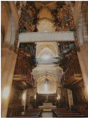
Catedral de Tuy