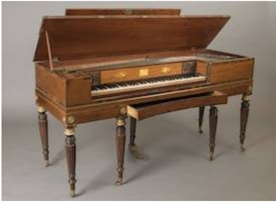
Piano de mesa (1816). Clementi & Company