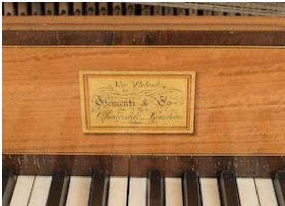
Piano de mesa (1816). Clementi & Company (detalle)