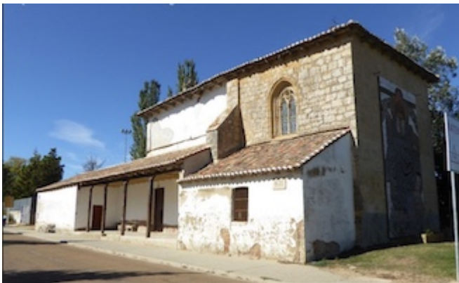
Ermita de Nuestra Señora de la Piedad