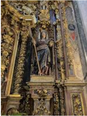
Santa Lucía. Alonso de Mena.