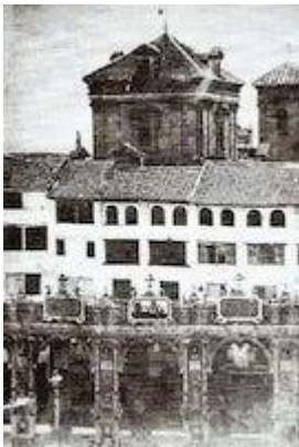
Iglesia de Santa María Magdalena desde la plaza de Bibarrambla