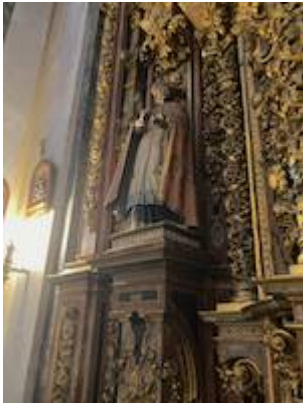
San Cecilio. Fotografía de Juan Ruiz Jiménez