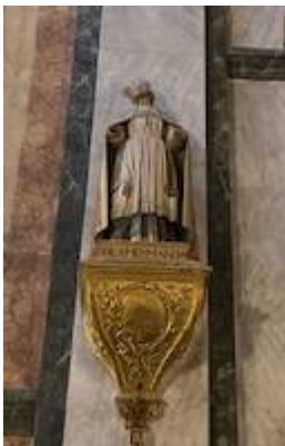
Imagen de devoción de la cofradía de las Ánimas del Purgatorio.