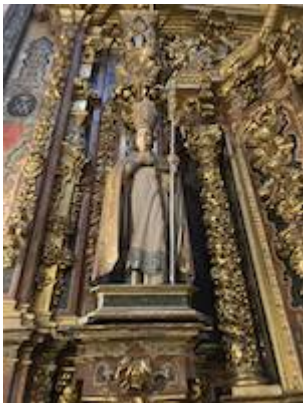
San Blas.