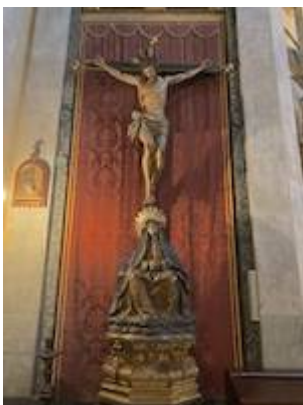
Cristo de la Esperanza y Virgen del Mayor Dolor.