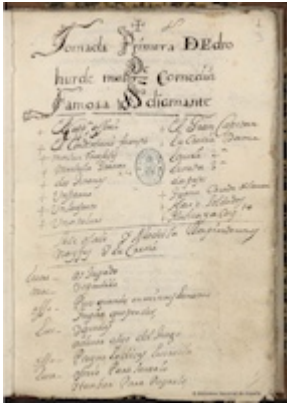
Pedro de Urdemalas