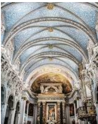
Iglesia de San Esteban