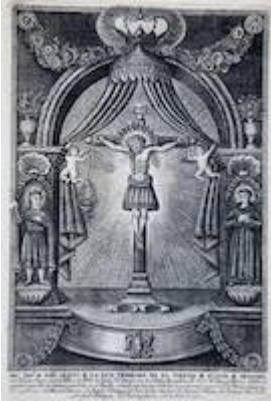
Cristo de la Luz