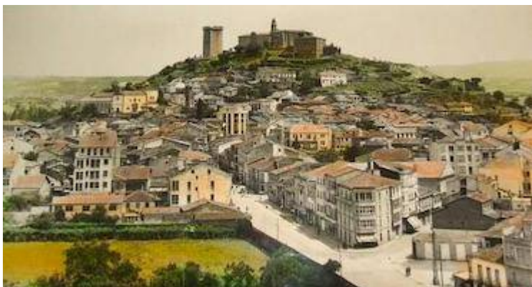
Monforte de Lemos