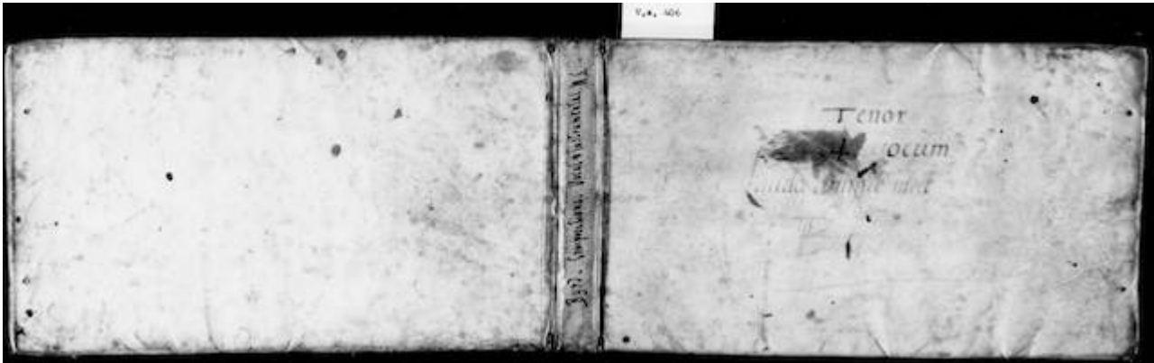
US-Ws V.a 406. Tenor