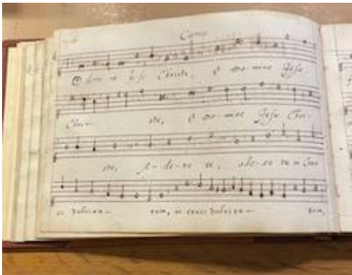
O Domine Jesu Christe. [Francisco Guerrero]. GB-Lbl Add. MS 41156, fol. 25v

"http://www.youtube.com/embed/JYZr1mAom8w?iv_load_policy=3&fs=1&origin=http://www.historicalsoundscapes.com"