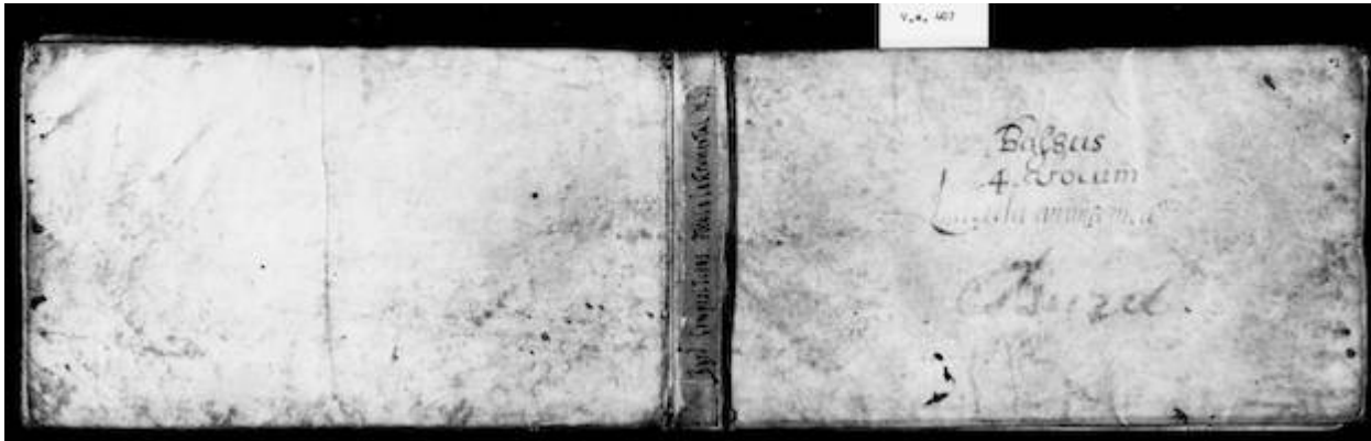
US-Ws V.a 407. Bassus