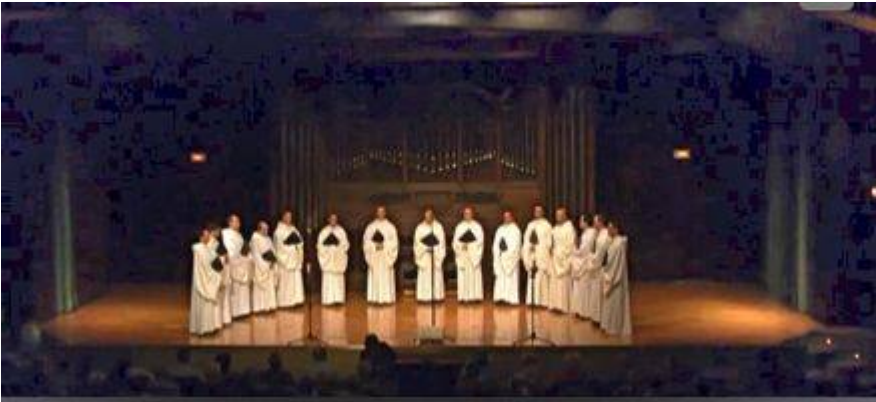
Salmo 94 y responsorio Libera me . Schola Antiqua. Músicas para bien morir. Réquiem . Fundación Juan March