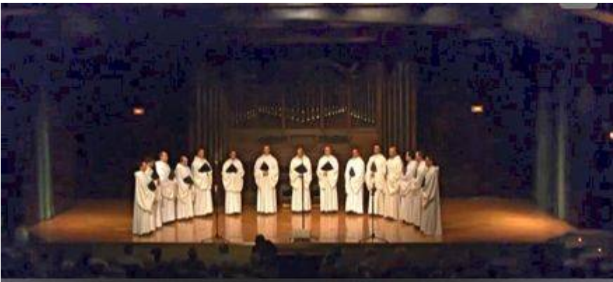
Salmo 94 y responsorio Libera me . Schola Antiqua. Músicas para bien morir. Réquiem . Fundación Juan March