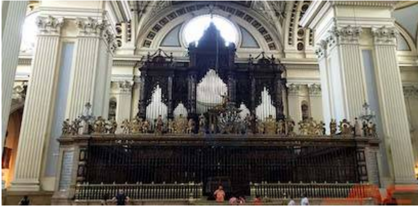
Coro de la antigua colegiata de Santa María la Mayor y del Pilar.