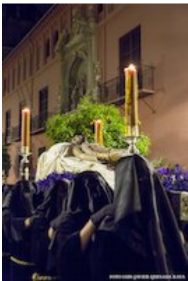
Cristo yacente. Atribuido a Diego de Aranda (siglo XVI)