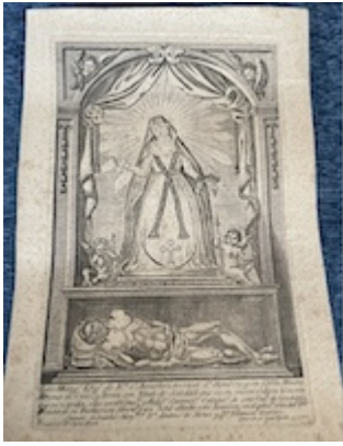
Grabado de Nuestra Señora de la Soledad y Entierro de Cristo (1788)