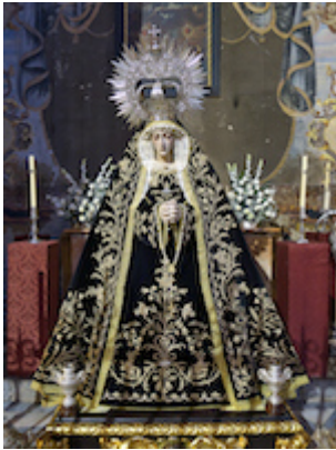
Nuestra Señora de la Soledad