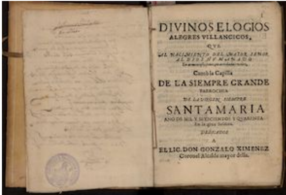
Divinos elogios, alegres villancicos... Écija: Juan Malpartida de las Alas, 1640