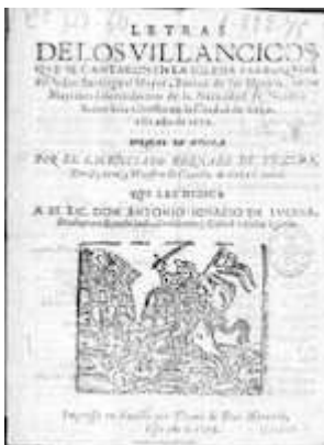
Letras de los villancicos que se cantaron en la iglesia parroquial del Señor Santiago el Mayor... Sevilla: Thomé de Dios Miranda, 1676