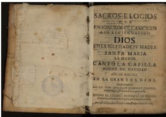
Sacros elogios que en sonoros villancicos... Écija: Juan Malpartida de las Alas, 1641