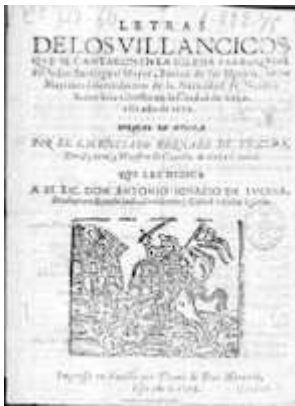
Letras de los villancicos que se cantaron en la iglesia parroquial del Señor Santiago el Mayor... Sevilla: Thomé de Dios Miranda, 1676