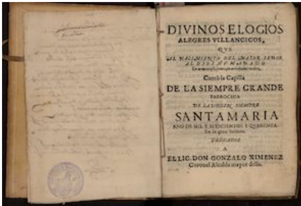
Divinos elogios, alegres villancicos... Écija: Juan Malpartida de las Alas, 1640