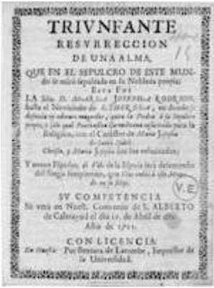
Triunfante resurrección de un alma.... Huesca: Ventura de Larumbe, 1721