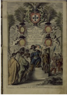
Historia geral de Ethiopia a Alta. Manoel d'Almeida. Coimbra: Offic. de Manoel Dias, 1660