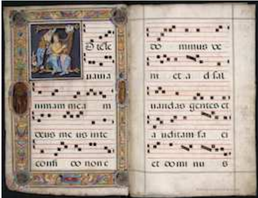
Biblioteca Nacional de España, MpCant/25, [fols. 1v-8r]