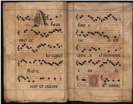
Biblioteca Nacional de España, MpCant/40, fols. XXXViv-XXXVIIr