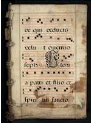
Biblioteca Nacional de España, MpCant/40, fols. IXr