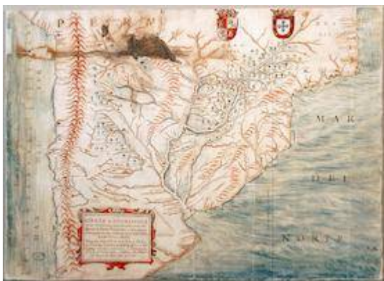
Carta geográfica.... Juan Ramón (1683)