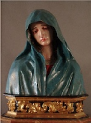
Esculturas del convento del Ángel Custodio