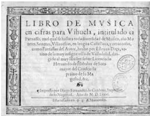
Portada. El Parnaso . Esteban Daza. Valladolid, 1576