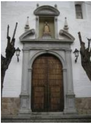
Fachada del convento de la Concepción.