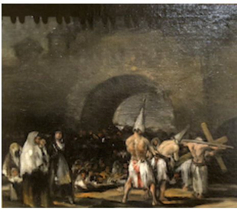
Escena de disciplinantes . Francisco de Goya