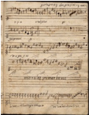
Deo dicamus gratias. Francisco Guerrero. E-Bim 1, fol. 36r