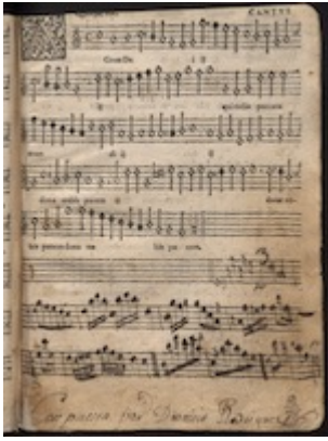
Missa Seculorum Amen. Francisco Guerrero. E-Bim 66, p. 70