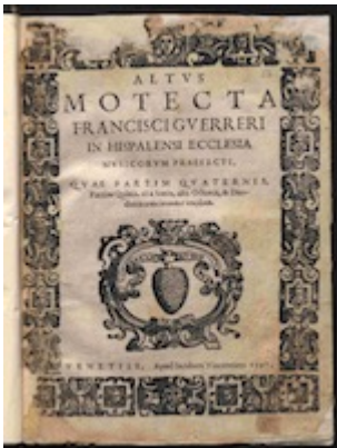
Portada librete Altus [E-Bim 67]