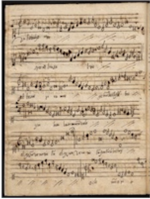
Salve regina. Francisco Guerrero. E-Bim 1, fol. 35v