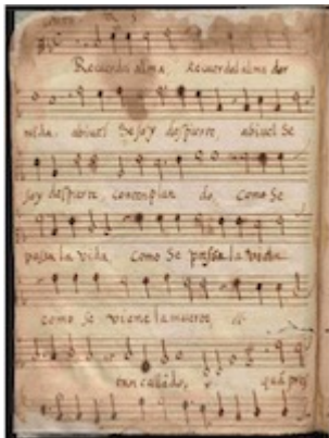
Recuerde el alma dormida. Francisco Guerrero. E-Bim 67