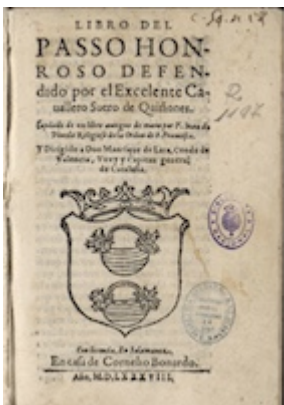
Libro del passo honroso (Salamanca, 1588)