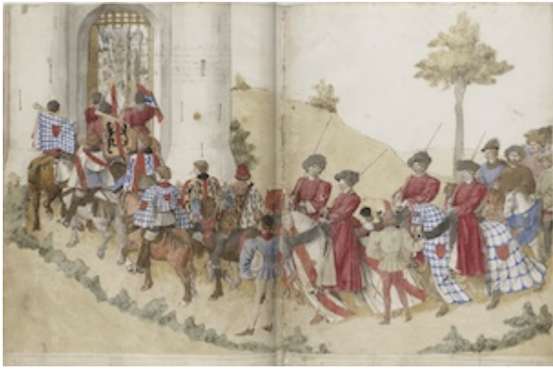
Caballeros. Traité de la forme et devis comme on peut faire les tournois . René I d'Anjou, fols. 57v-58rr