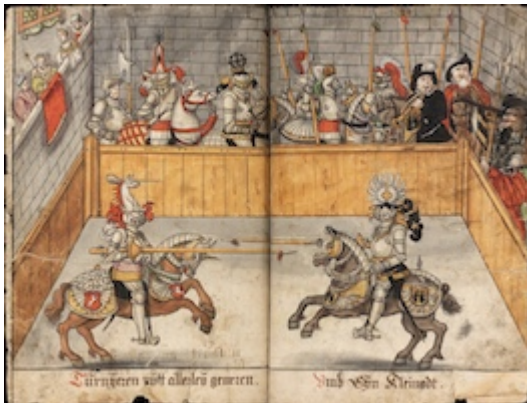
Turnierbuch, fols. 56-57