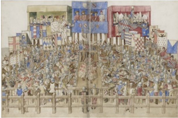
Torneo. Traité de la forme et devis comme on peut faire les tournois . René I d'Anjou, fols. 97v-98rr