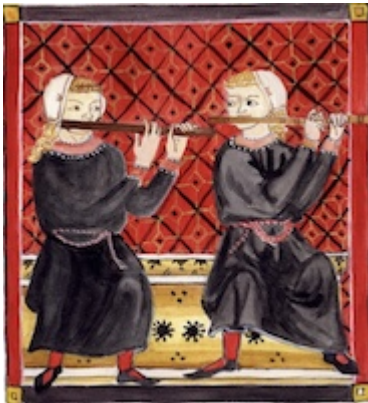
Ajabeba. Cantigas de Santa María . Códice de los músicos (E)