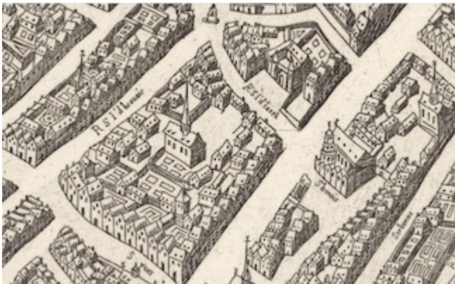
Rue Saint-Jean-de-Latran (1609)