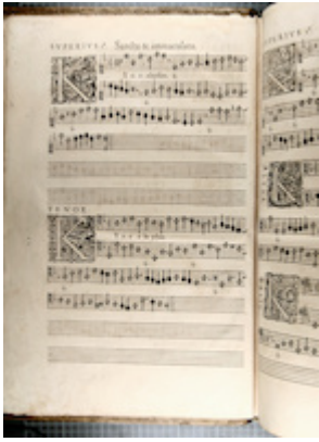
Liber primus missarum (París, 1566), fol. 2v. [CH-E Mw1]