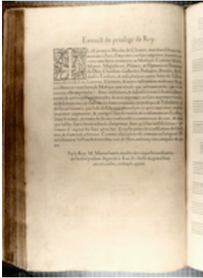
Privilegio de impresión. Liber primus missarum (París, 1566). [CH-E Mw1]