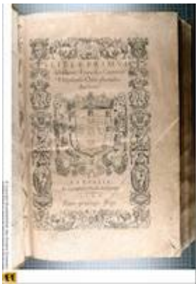
Portada. Liber primus missarum (París, 1566). [CH-E Mw1]