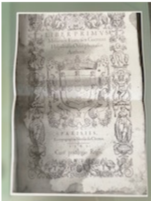
Portada. Liber primus missarum (París, 1565). [E-TE 01-002]

"http://www.youtube.com/embed/77wign58td0?iv_load_policy=3&fs=1&origin=http://www.historicalsoundscapes.com"