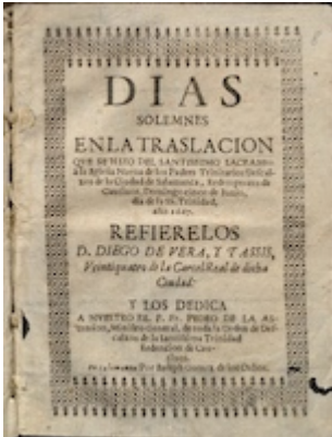
Días solemnes.... Diego de Vera y Tasis (portada)