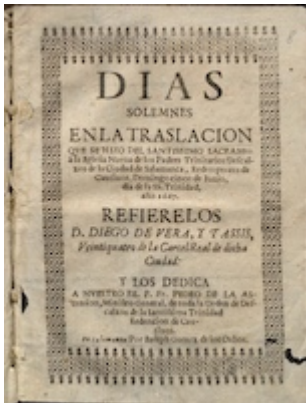
Días solemnes.... Diego de Vera y Tasis (portada)