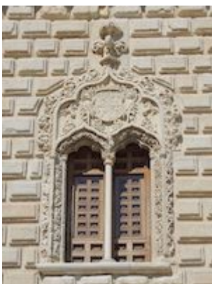
Ventana del Palacio ducal de Cogolludo (Guadalajara)

https://embed.spotify.com/?uri=https://open.spotify.com/track/2KkAk7u7vIM9dWkDur6WYK