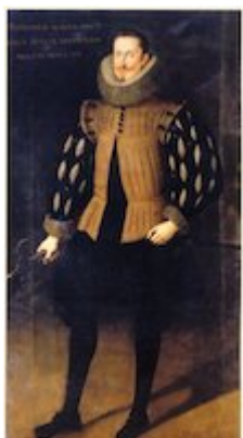
Retrato de Ruy Gómez de Silva Mendoza, III duque de Pastrana. Bartolomé González Serrano (1564-1627)

"https://embed.spotify.com/?uri=https://open.spotify.com/track/2Q2SJ2wO1uBz1LGHN89RDe