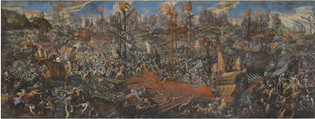
Batalla de Lepanto. Andrea Vicentino (1580)