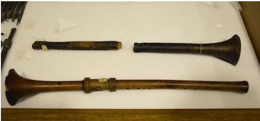
Chirimías (s. XVI). Catedral de Salamanca