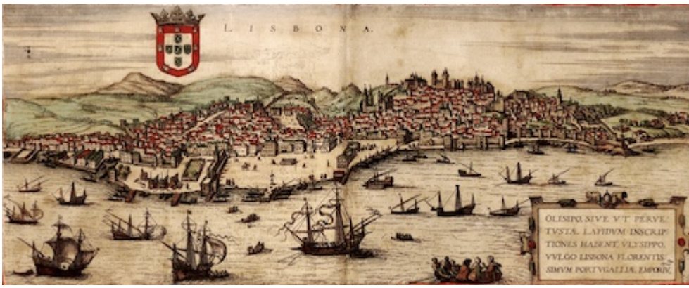
Puerto de Lisboa. Civitatis orbis terrarum (1572)